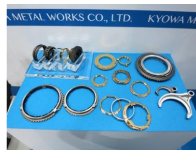
量産品 (レバー/銅合金/鉄樹脂シンクロナイザー・シフトフォーク)