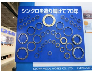
壁掛けシンクロナイザーラインナップ