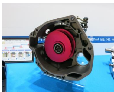
保持エネルギーレスクラッチ装置