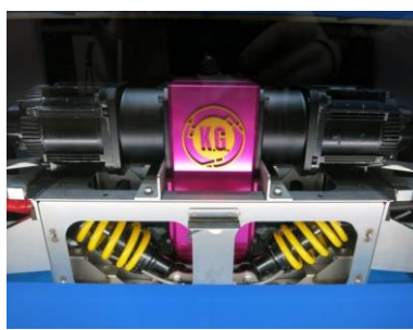
EV用4速シームレス変速機