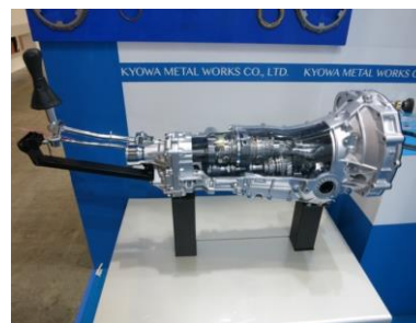
トランスミッションカットモデル